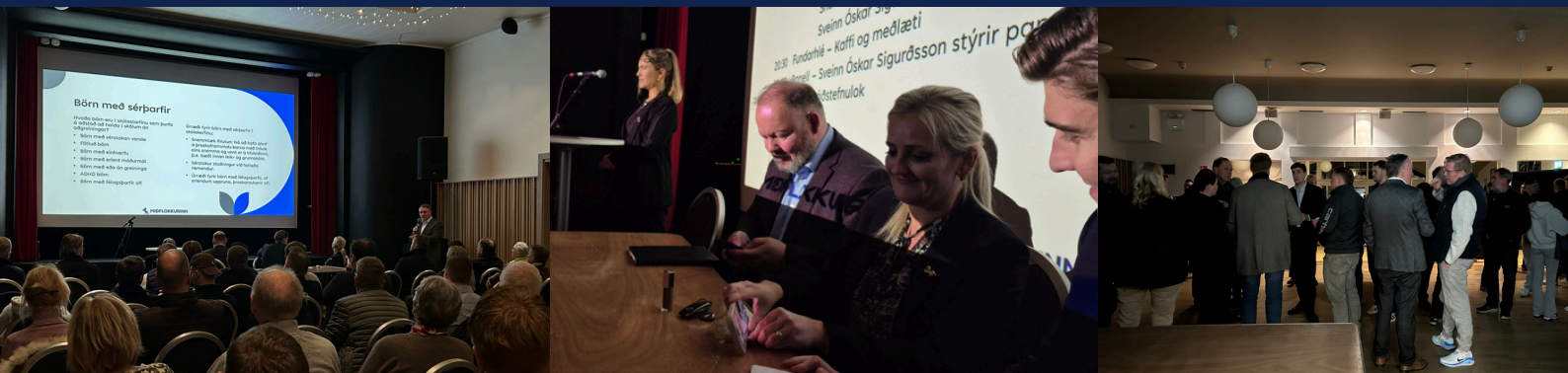
MANNFAGNAÐIR Í MOSÓ, FUNDARHÖLD & STEFNUMÓTUN 2026