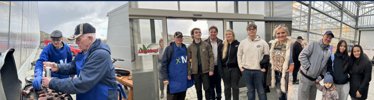
UNGLIÐAGLEÐI Á BLIK BISTRÓ 23. OKTÓBER 2025