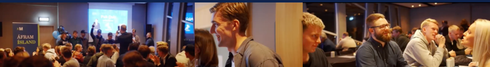
OPIN RÁÐSTEFNA UM FJÖLSKYLDUNA, BÖRN OG UNGMENNI Í HLÉGARÐI 11. NÓVEMBER 2025